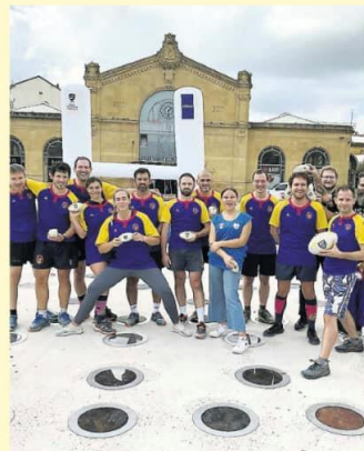
Les licenciés de Meurthe-et-Moselle ont participé à une grande opération de séduction en marge du train de la Coupe du Monde.