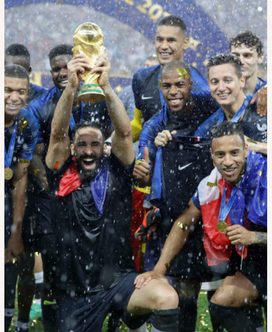
15/07/2018, finale de coupe du monde France 4 - 2 Croatie

J'ai toujours aimé le sport. J'en ai moi-même fait longtemps. Du judo, de la gymnastique, du tennis, de la danse en passant par différents styles et de la musculation en salle, j'aime faire du sport tout comme j'aime en regarder à la télé. J'ai toujours trouvé que le Business sportif avait quelque chose de fascinant. Les sponsors, les équipes, la gestion d'un club, les rassemblements autour d'un même match, les conseils nutrition, les salles de sports... Ma curiosité s'emballe et j'aimerais faire partie, moi aussi, de ce milieu plus que passionnant à mes yeux. Je le sens, c'est ma voie.