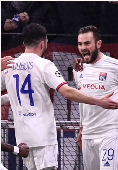
8e de finale de LDC - OL/JUVENTUS - 26/02/2020

Pourquoi me choisir moi et pas quelqu'un d'autre ?